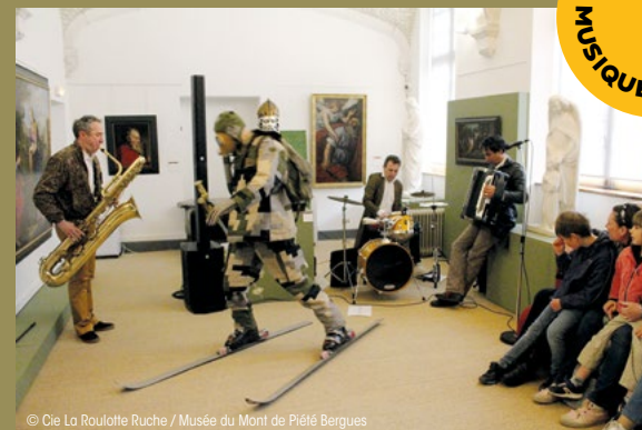
© Cie La Roulotte Ruche / Musée du Mont de Piété Bergues

Du 24 au 28 avril 2024, dans les musées / en Flandre et ses environs.